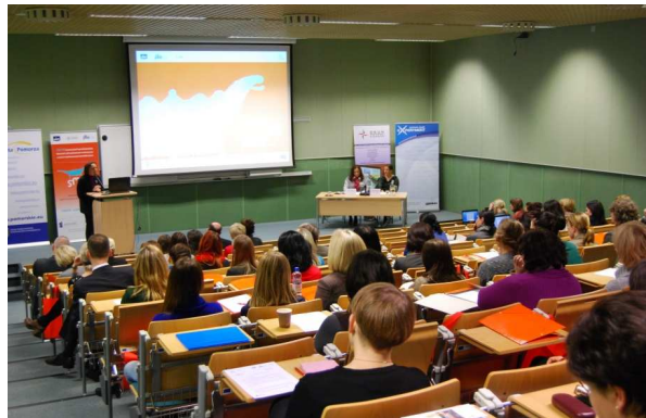
Minister Katarzyna Hall